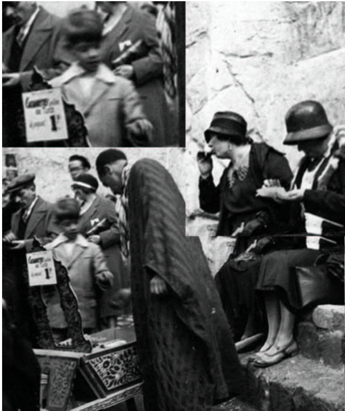
Looks: Ambulanter Verkäufer mit Besucherinnen