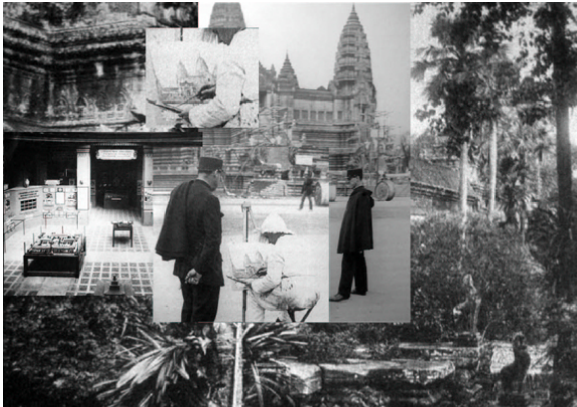
Angkor Wat: Rekonstruktion in Paris 1931 – Innenraum des <Pavillon de l'Indochine> – Ruine von Angkor Wat in Kambodscha

Die Polizei tritt in diesem Bild weder als eine repressive Macht noch als eine Gewalt anwendende Institution auf. Vielmehr zeigt sie sich als eine neugierig engagierte, der Konstruktion und Repräsentation einer Idee von „Regierung“, die durch den im Bau befindlichen Tempel Angkor Wat versinnbildlicht wird, hilfreich zur Seite stehende Institution. Fassen wir den gesellschaftlichen Platz des Malers als eines Individuums, das sowohl als Rezipient wie als produktiver Multiplikator der in Konstruktion begriffenen „Plus Grande France“ fungiert, so entspricht der hier repräsentierte polizeiliche Blick ganz dem Platz eines Mediators zwischen der Entität des französischen Staates und dem Individuum – also einem Bürger, der sich im besten Falle selbst regiert. Was aber ist 1931