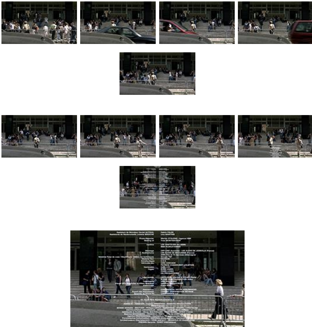
Snapshots aus Michael Hanecke, Caché (2005)

Heide Schlüpmann hat das Fotogen-Werden im frühen Kino, das damals viel beschworene photogénie , das die Fähigkeit des Films bezeichnet, Lebendigkeit, Sichtbarkeit oder Schönheit zu steigern, [24] beschrieben als Rücknahme des eigenen Vermögens der Einbildungskraft, als „Rücknahme der Körperführung in die Bewegtheit äußerer Wirklichkeit“ zugunsten ihrer Herstellung im Kino. [25] Auch der Schauspieler, nicht nur die Kamerafrau stelle