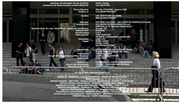
Snapshots aus Michael Hanecke, Caché (2005)