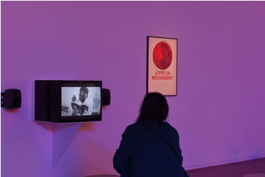
Vincent Meessen, Juste Un Mouvement CinémaOmarx (#2), Installation view, Centre Pompidou, 2018

Omar Blondin Diop ist die zentrale Figur der Ausstellung, die sowohl 1968 in transnationaler Perspektive betrachtet und sich für die Zirkulation des Maoismus, Marxismus und seiner Kritik zwischen Dakar und Paris interessiert, als auch nach einer künstlerischen Form sucht, welche die Bewegung, in der Politik und Ästhetik konvergieren, in die Gegenwart verlängert.