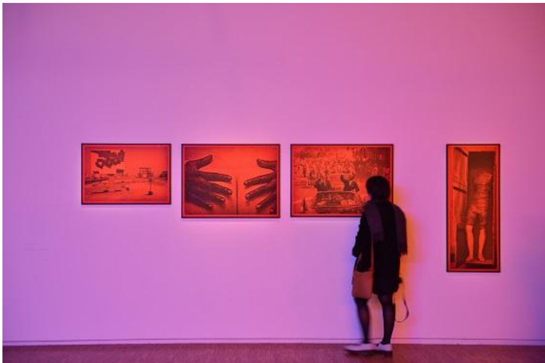
Vincent Meessen, Quinconce Exhibition view, Centre Pompidou, 2018

Geschichte Omar Blondin Diops zu vermitteln, nimmt die Installation eine fixe Objektgestalt an. Die Siebdruckrahmen werden zu ästhetischen Objekten und verlieren ihre Anwendbarkeit. Die ästhetisierte Form lässt wenig Raum für die Unvorhersagbarkeit und Polyphonie gesellschaftskritischer Bewegungen.